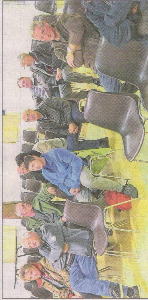
■ Faible assistance vendredi soir, pour élire le nouveau conseil d'administration.